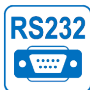
RS232* Тъч Контролер