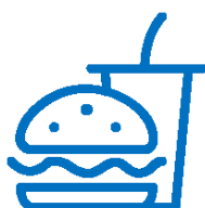
Заведения за бързо хранене