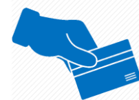
Четец за магнитни карти