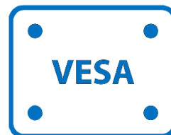
75mm x 75mm