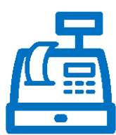
Point Of Sale