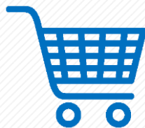
Супер и Хипермаркети