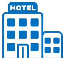
Хотели и Мотели