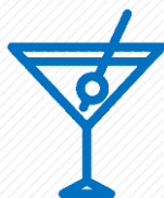
Барове и Дискотеки