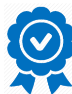
3 години гаранция