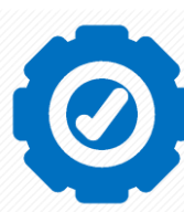
Индустриален клас техника